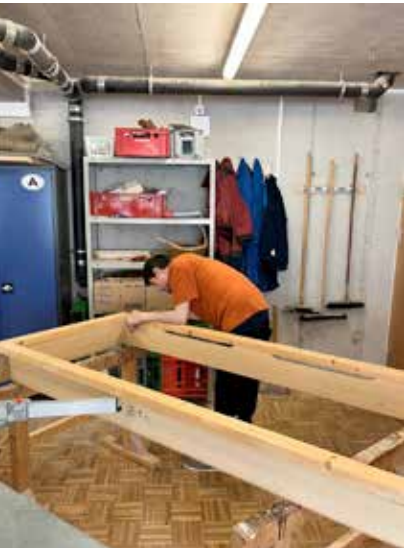
Die KlientInnen der WG fertigen innerhalb der Tagesstruktur verschiedene Werkstücke an.