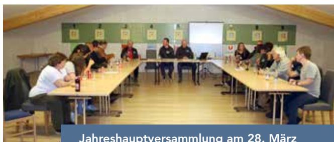
Jahreshauptversammlung am 28. März

Beim heurigen Landesschießen des Bundes der Tiroler Schützenkompanien und des Tiroler Landesschützenbund haben wir am 7. Mai 2025 am Schießstand der Schützengilde Imst teilgenommen. Wir haben sieben mal die Auszeichnung Meisterschütze erreicht.