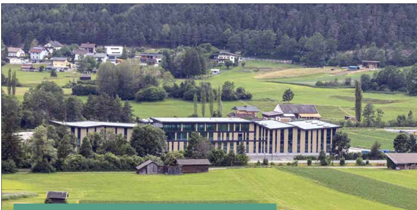
Der Neubau der Betriebsanlage von Swacrit Systems schreitet voran.

Mit der Eröffnung der neuen Kinderkrippe kann die ganztägige Betreuung