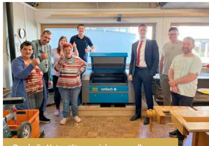
Durch die Unterstützung vieler – vor allem des Hauptsponsors SPARKASSE – konnte der neue Lasercutter ermöglicht werden.