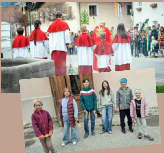
Am Palmsonntag beim Majenbrunnen und beim traditionellen Ratschen am Karfreitag und Karsamstag