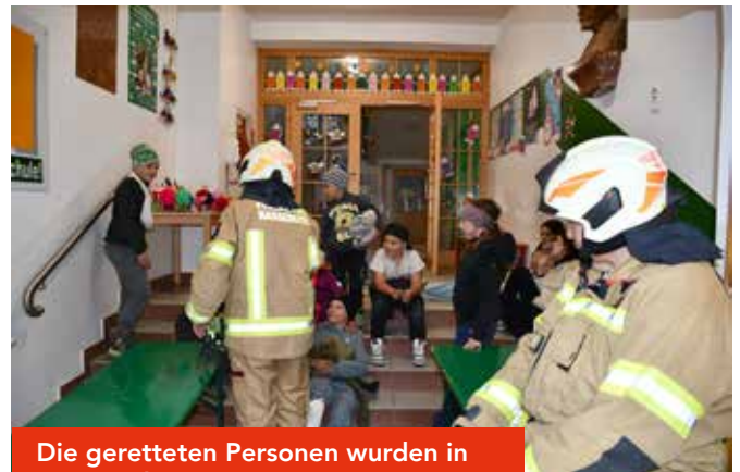
Die geretteten Personen wurden in der Schule erstversorgt.

Holzbau Tirol. Aus Holz gebaut. Auffallend genial.