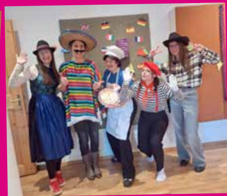
Unsere tolle Faschingsparty (mit beiden Gruppen gemeinsam) darf auf keinen Fall in unserem Programm fehlen – diesmal zum Thema „Reise um die Welt“! Auch unser derzeitiges (ehrenamtliches) JS-Betreuerinnen-Team war mit vollem Eifer und guter Laune dabei – DANKE an dieser Stelle für alle investierte Zeit u. Mühe (das ganze Jahr über) !!!!