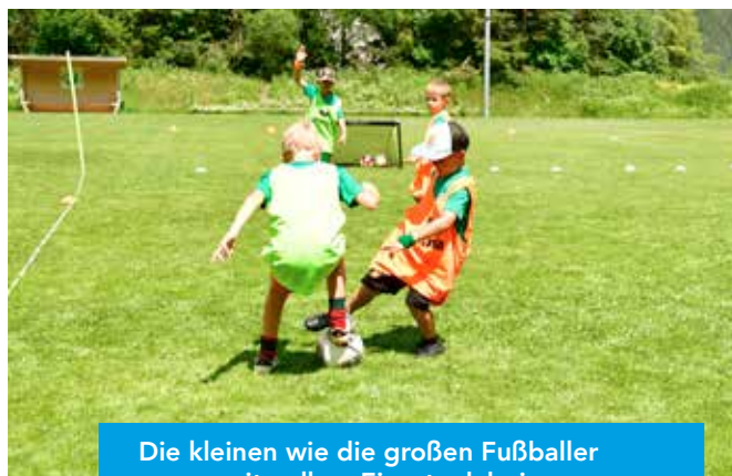
Die kleinen wie die großen Fußballer waren mit vollem Einsatz dabei.