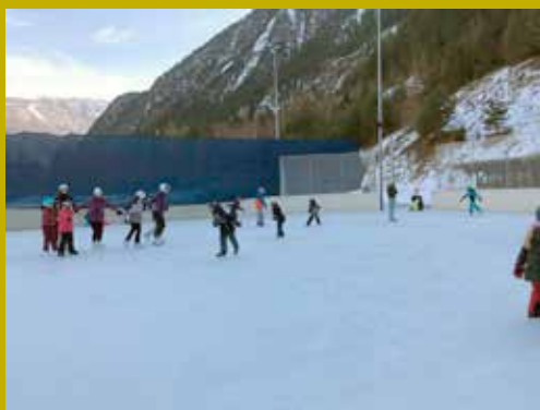
Heuer verbrachten wir auch einen Nachmittag am Eislaufplatz, bei lustigen Spielen am Eis.