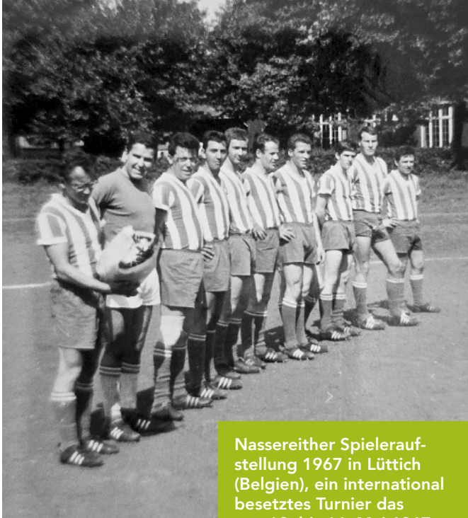
Nassereither Spieleraufstellung 1967 in Lüttich (Belgien), ein international besetztes Turnier das von 12. bis 16. Mai 1967 dauerte.

den Besonderheiten ihrer Heimstätte vertraut, die Gästemannschaften hingegen nicht. Und so kam es, dass die Nassereither Fußballer sensationell die erste Saison 1965/66 mit dem Meistertitel in ihrer Liga abschlossen.