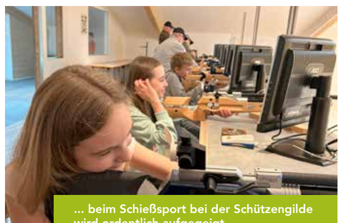
... beim Schießsport bei der Schützengilde wird ordentlich aufgegeigt