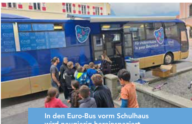
In den Euro-Bus vorm Schulhaus wird neugierig hereinspaziert ...

Unsere Kinder sind mit großer Begeisterung in das Geschehen der Gemeinde eingebunden. Sei es beim Schnöllen in der Fasnachtszeit oder am Unsinnigen, bei dem sie beim Umschlagen zuschauen und anschließend kostümiert im Gemeindesaal sich austoben konnten. Auch bei besonderen Anlässen zeigt die Schule Flagge: Anlässlich des 100. Geburtstags unseres ältesten Gemeindegägers, Willi Prosen, versammelten sich die Kinder, um mit bunten Fahnen und