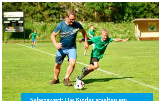
Sehenswert: Die Kinder spielten am letzten Tag gegen ihre Eltern.