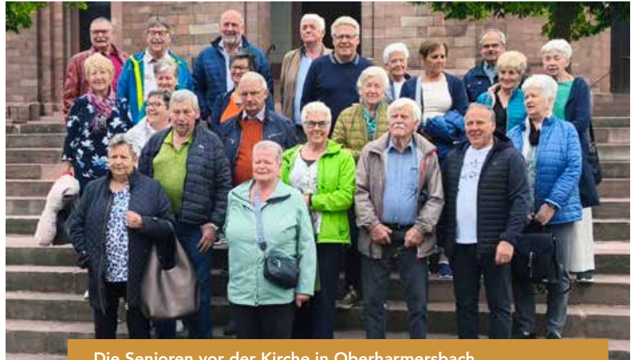
Die Senioren vor der Kirche in Oberharmersbach.

nen Abstecher zu dem auf ca. 1.000 m Höhe liegenden Mummelsee, um im gleichnamigen Hotel ein leckeres Stück der weltbekannten Schwarzwälder Kirschtorte zu genießen.