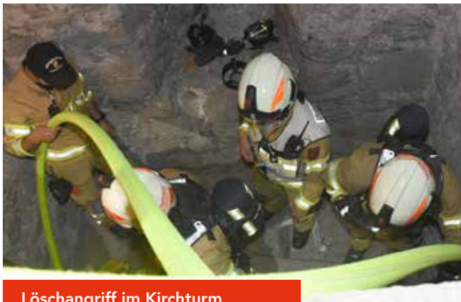
Löschangriff im Kirchturm