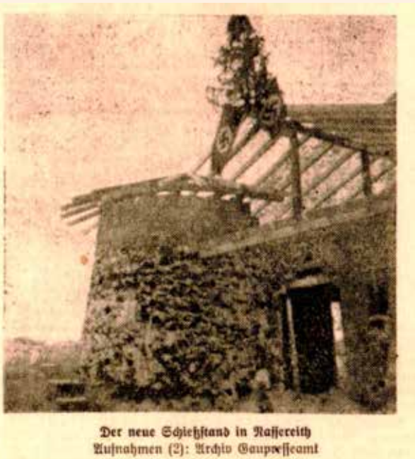
Der neue Schießstand in Raffereith

(Teil III von „Böse Bauten“ in der nächsten Ausgabe des „Nassreider“.)