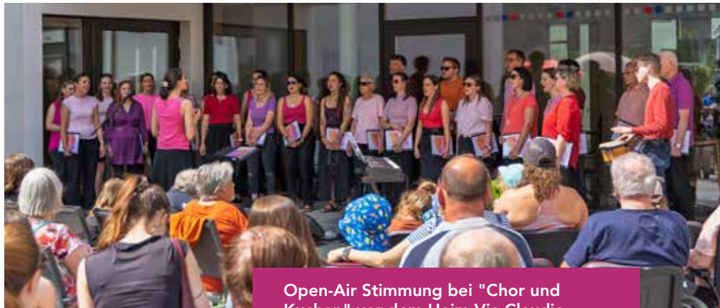
Open-Air Stimmung bei "Chor und Kuchen" vor dem Heim Via Claudia

Am 9. Juni luden wir noch - bereits das dritte Jahr in Folge - zu „Chor und Kuchen" ins Heim Via Claudia ein. Dort durften wir den HeimbewohnerInnen und dem erschienenen Publikum den Nachmittag versüßen: Musikalisch mit einem kurzen Open-Air Konzert,