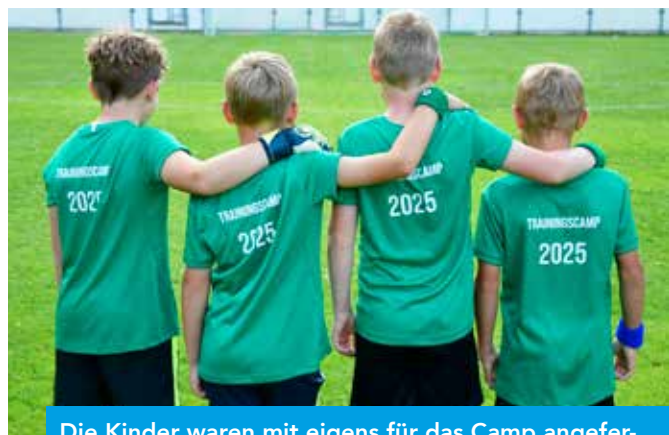
Die Kinder waren mit eigens für das Camp angefertigten Shirts bestens für das Training ausgerüstet.

Der FC Nassereith bedankt sich herzlich bei allen Helferinnen und Helfern, bei den engagierten Eltern, den teilnehmenden Kindern sowie bei unseren großzügigen Sponsoren TUI und Gurgltalbro t für ihre wertvolle Unterstützung – ohne euch wäre dieses besondere Event nicht möglich gewesen!