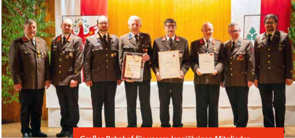
Großer Bahnhof für unsere langjährigen Mitglieder