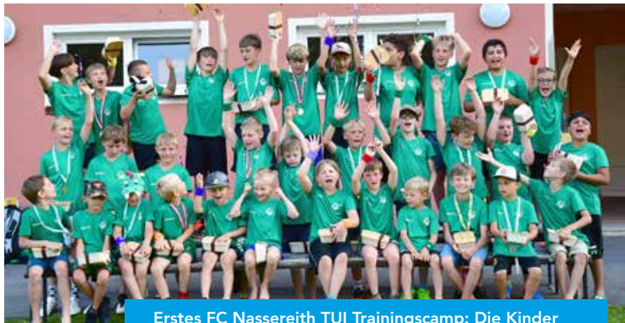
Erstes FC Nassereith TUI Trainingscamp: Die Kinder hatten an allen drei Tagen jede Menge Spaß.

Schon am ersten Tag war die Vorfreude groß: Nach dem Aufbau der Zelte standen erste "lockere" Trainingseinheiten auf dem Plan. Doch bereits am zweiten Tag wurde es richtig intensiv: Frühsport nach dem Aufstehen, ein spannendes „Ballo Ballone“-Turnier und professionelle Trainingseinheiten mit Spielern und dem Trainer der Kampfmannschaft