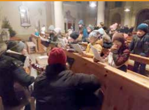
Gemeinsame Rorate-Messe frühmorgens und anschließendes Frühstück im frisch renovierten Pfarrsaal – die Kinder halfen eifrig mit!