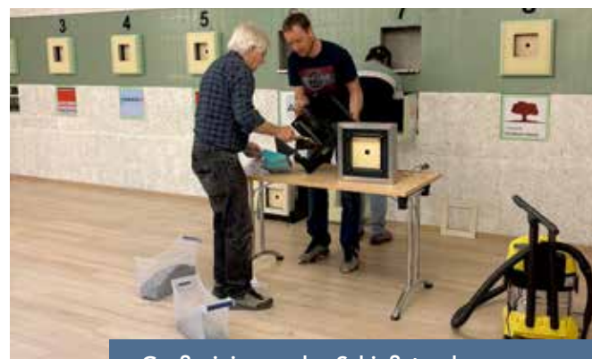
Großreinigung des Schießstandes