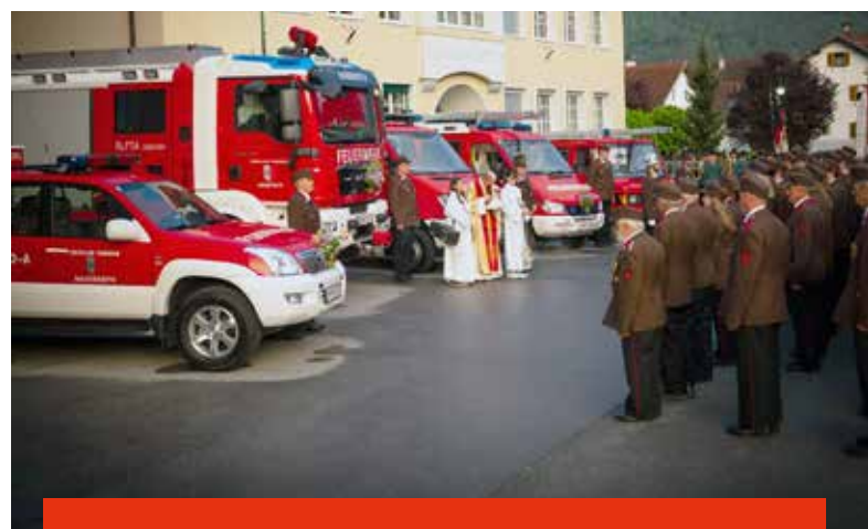
Unsere Mannschaft und Einsatzfahrzeuge bei der feierlichen Segnung.