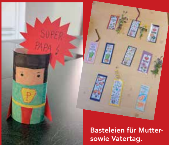
Basteleien für Mutter- sowie Vatertag.

Immer wieder im Kirchenjahr finden in unserer Pfarre Familienmessen statt, die wir von der Jungschar gesanglich und mit Texten mitgestalten. Anschließend wird von einem engagierten Team ein Pfarrcafé angeboten, wozu jede/r herzlich eingeladen ist. Bei Schönwetter singen wir die Lieder zum Üben dafür kurzerhand auch mal im Freien durch!