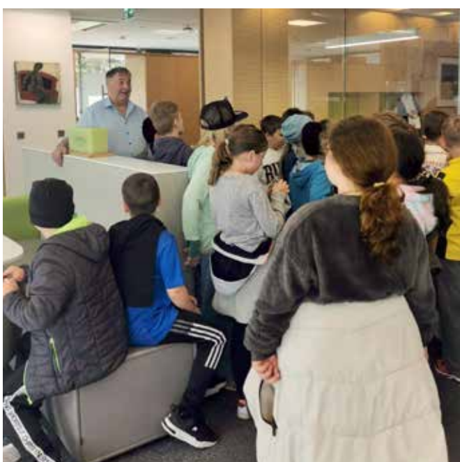
... die Fragen der Kinder im Gemeindeamt erfreu'n unseren Bürgermeister sehr!