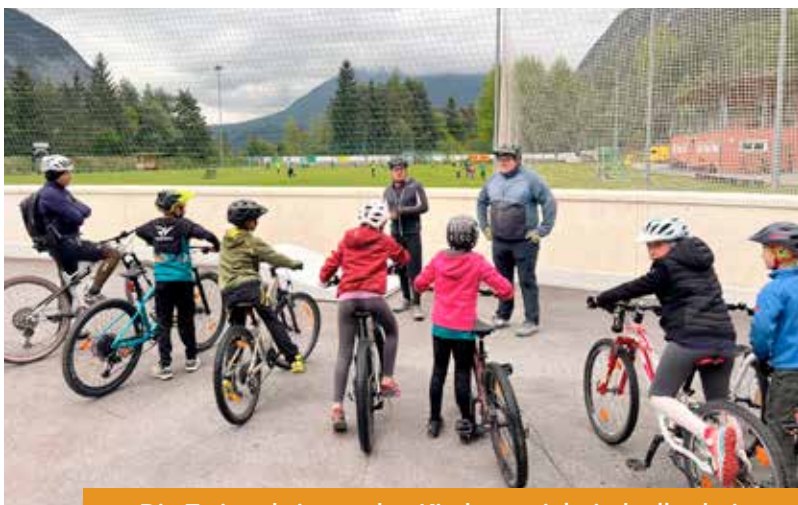
Die Trainer bringen den Kindern spielerisch alles bei, was sie fürs sichere Fahren brauchen – Kurventechnik, Gleichgewicht und richtiges Bremsen.

Wir freuen uns auf eine tolle Saison mit vielen schönen Erlebnissen auf zwei Rädern!