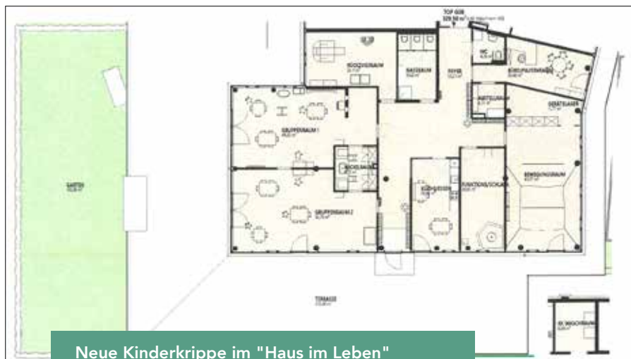
Neue Kinderkrippe im "Haus im Leben" mit großzügigem Außenbereich

Der Außenbereich umfasst ca. 500 m 2 Freifläche, auf der ein neuer Kin-