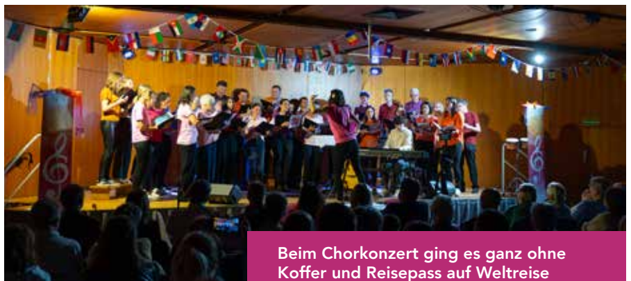
Beim Chorkonzert ging es ganz ohne Koffer und Reisepass auf Weltreise

kulinarisch mit selbst gebackenem Kuchen.